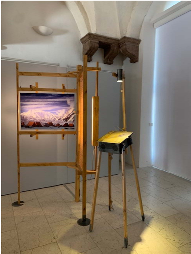
Figura 3. Modulo di base composto da pannello e leggìo. Sono 6 e si possono disporre anche separatamente.