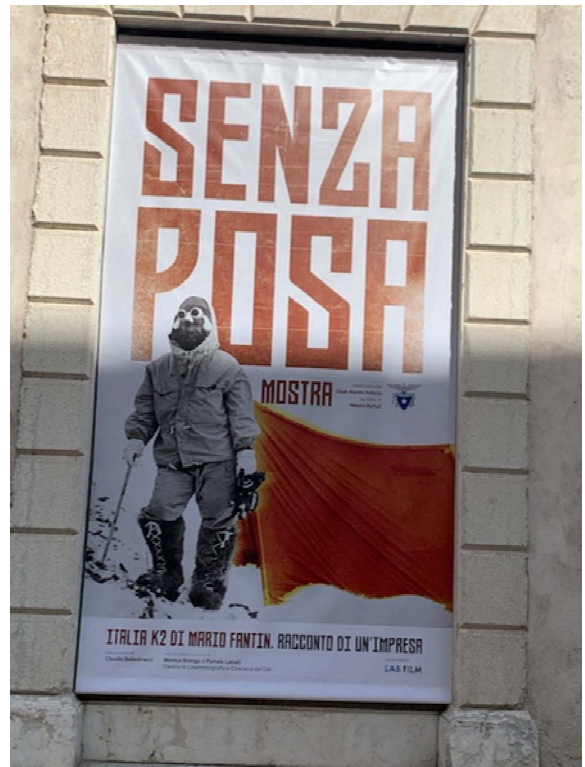
Figura 2. Installazione del grande poster all'esterno della mostra.